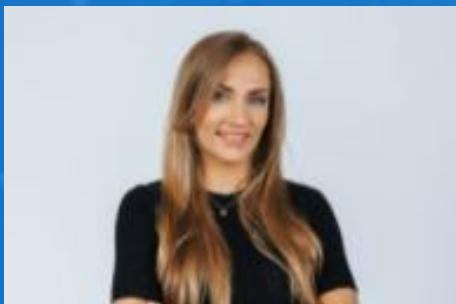
Santa Mazure Pārdošanas speciāliste